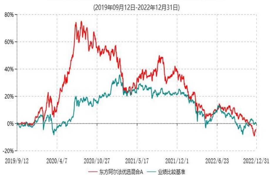
东方阿尔法优选混合A累计净值增长率与业绩比较基准收益率历史走势对比图