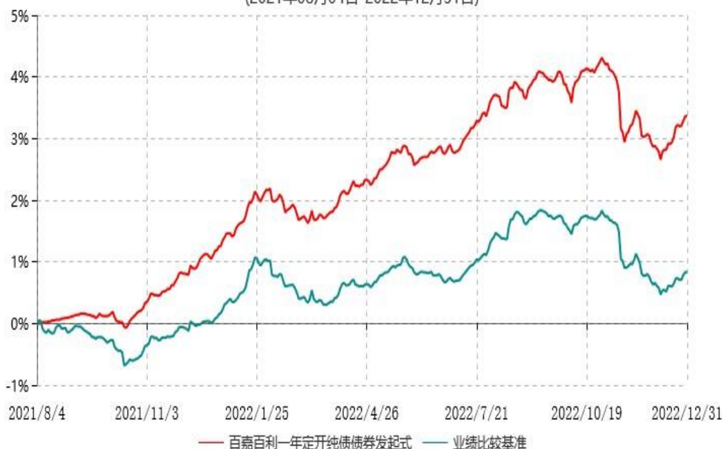
百嘉百利一年定期开放纯债债券型发起式证券投资基金累计净值增长率与业绩比较基准收益率历史走势对比图 (2021年08月04日-2022年12月31日)

注：本基金的投资组合比例为：债券资产占基金资产的比例不低于80%；但在每次开放期开始前1个月、开放期及开放期结束后1个月的期间内，基金投资不受上述比例限制；在开放期内，每个交易日日终在扣除国债期货合约需缴纳的交易保证金后，本基金持有现金或者到期日在一年以内的政府债券投资比例不低于基金资产净值的5%，封闭期内不受上述5%的限制，但每个交易日日终在扣除国债期货合约需缴纳的交易保证金后，应当保持不低于交易保证金一倍的现金，其中现金不包括结算备付金、存出保证金、应