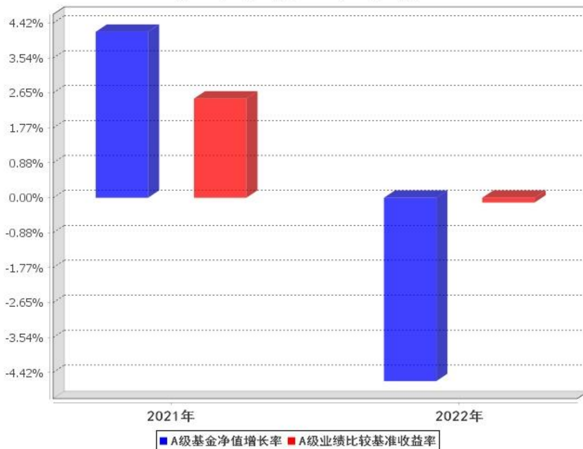
A级自基金合同生效以来基金每年净值增长率及其与同期业绩比较基准收益率的对比图 (2021年3月23日至2022年12月31日)