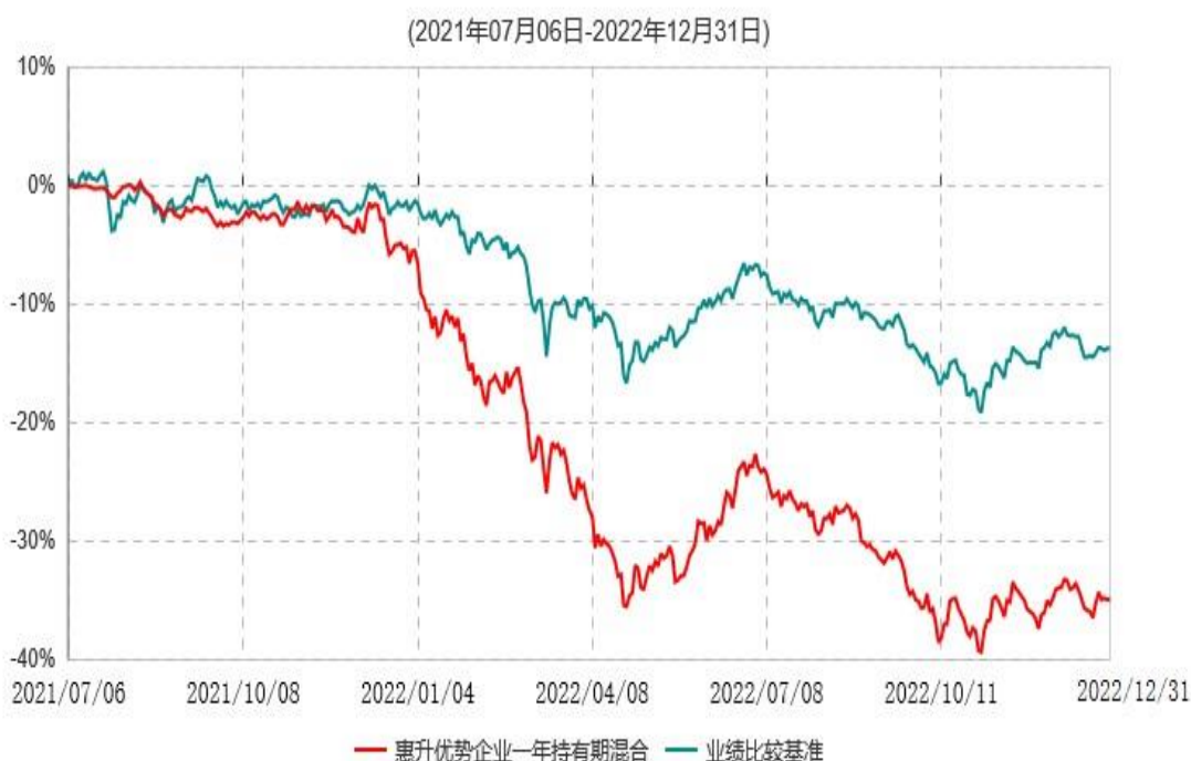
惠升优势企业一年持有期灵活配置混合型证券投资基金累计净值增长率与业绩比较基准收益率历史走势对比图