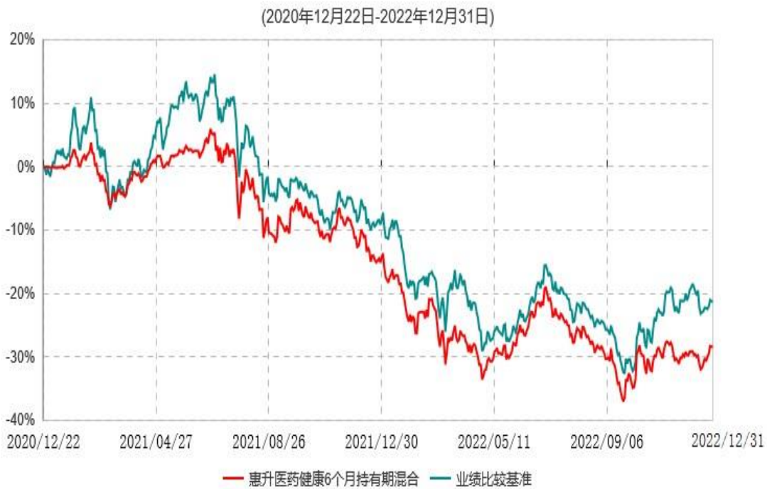
惠升医药健康6个月持有期混合型证券投资基金累计净值增长率与业绩比较基准收益率历史走势对比图