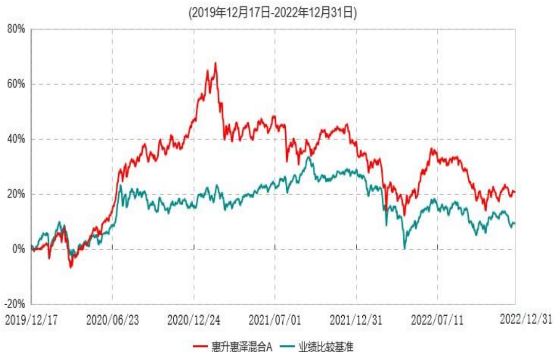
惠升惠泽混合C累计净值增长率与业绩比较基准收益率历史走势对比图