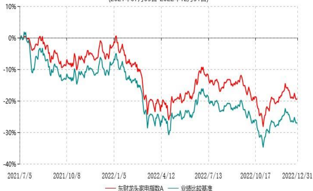
东财龙头家电指数C累计净值增长率与业绩比较基准收益率历史走势对比图