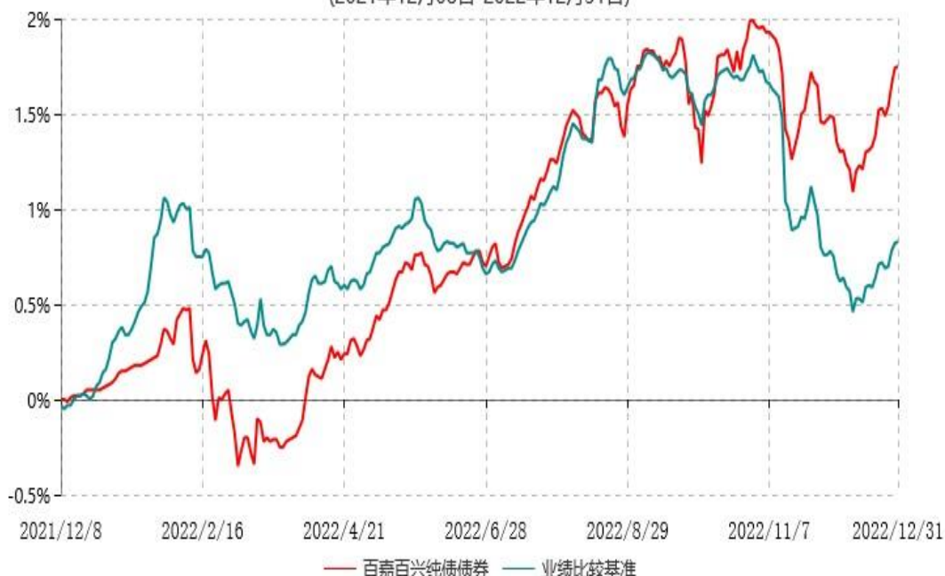
百嘉百兴纯债债券型证券投资基金累计净值增长率与业绩比较基准收益率历史走势对比图 (2021年12月08日-2022年12月31日)

注：本基金的投资组合比例为：债券资产占基金资产的比例不低于80%；每个交易日日终在扣除国债期货合约需缴纳的交易保证金后，本基金持有现金或者到期日在一年以内的政府债券投资比例不低于基金资产净值的5%，其中现金不包括结算备付金、存出保证金、应收申购款等。按基金合同和招募说明书的约定，本基金的建仓期为六个月，本报告期末距建仓结束不满一年，建仓期结束时本基金资产配置比例符合基金合同约定。