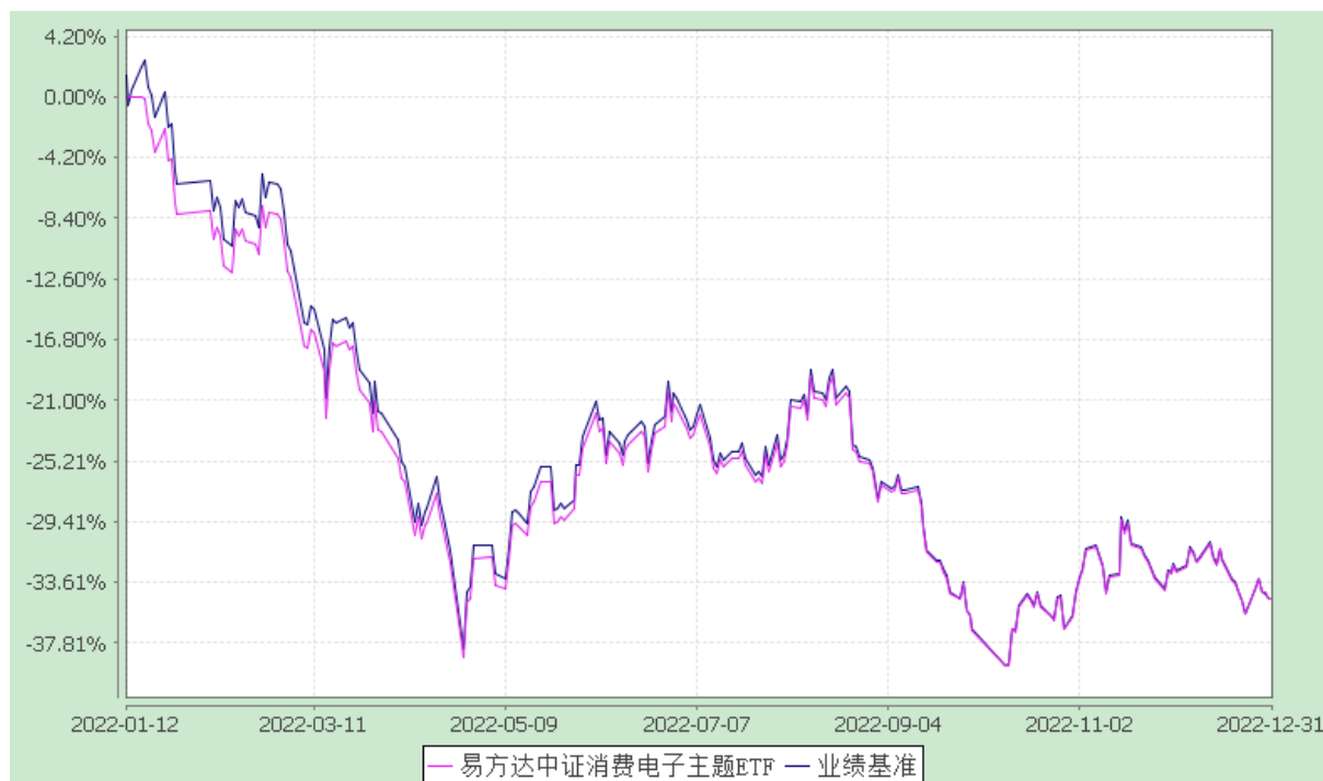
易方达中证消费电子主题交易型开放式指数证券投资基金 份额累计净值增长率与业绩比较基准收益率历史走势对比图 (2022 年 1 月 12 日至 2022 年 12 月 31 日)

注：1.本基金合同于 2022 年 1 月 12 日生效，截至报告期末本基金合同生效未满一年。