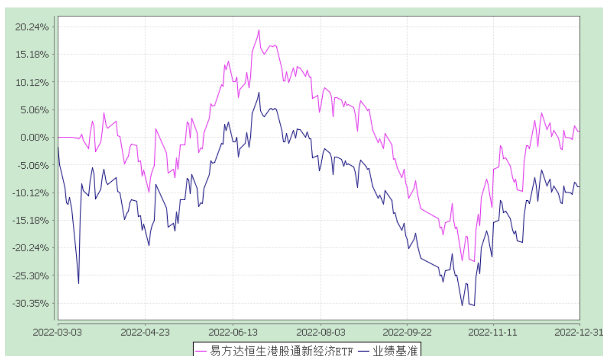
易方达恒生港股通新经济交易型开放式指数证券投资基金 份额累计净值增长率与业绩比较基准收益率历史走势对比图 (2022年3月3日至2022年12月31日)