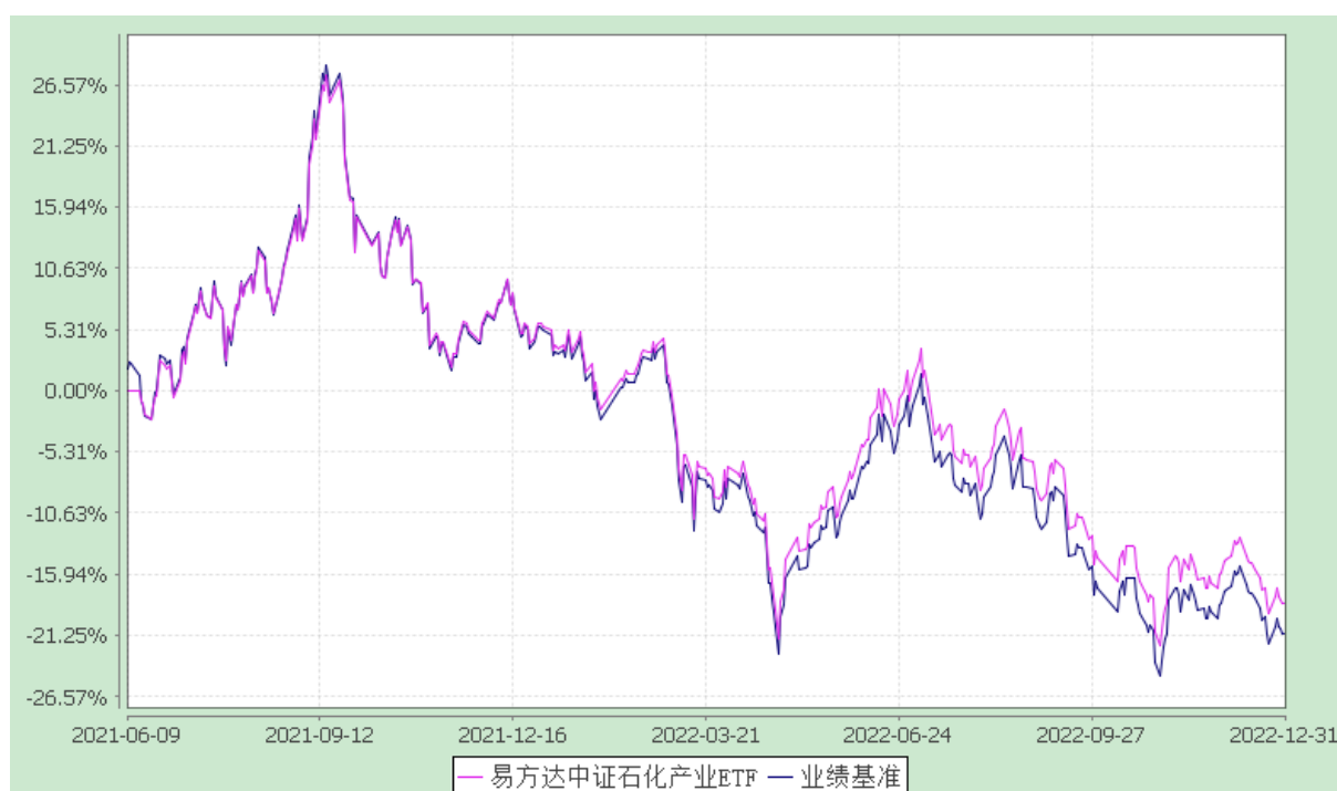
易方达中证石化产业交易型开放式指数证券投资基金 份额累计净值增长率与业绩比较基准收益率历史走势对比图 (2021年6月9日至2022年12月31日)

注：自基金合同生效至报告期末，基金份额净值增长率为-18.54%，同期业绩比较基准收益率为-21.13%。