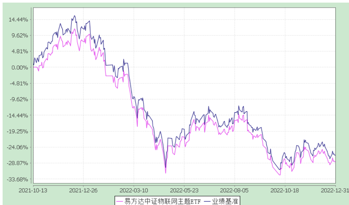
易方达中证物联网主题交易型开放式指数证券投资基金 份额累计净值增长率与业绩比较基准收益率历史走势对比图 (2021年10月13日至2022年12月31日)

注：1.按基金合同和招募说明书的约定，本基金的建仓期为六个月，建仓期结束时各项资产配置比例符合基金合同（第十四部分二、投资范围，三、投资策略和四、投资限制）的有关约定。