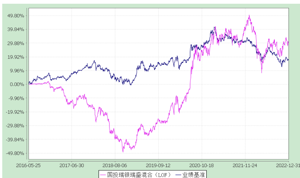
国投瑞银瑞盛灵活配置混合型证券投资基金(LOF) 份额累计净值增长率与业绩比较基准收益率的历史走势对比图 (2016 年 5 月 25 日至 2022 年 12 月 31 日)

注：本基金建仓期为自基金合同生效日起的 6 个月。截至建仓期结束，本基金各项资产配置比例符合基金合同及招募说明书有关投资比例的约定。