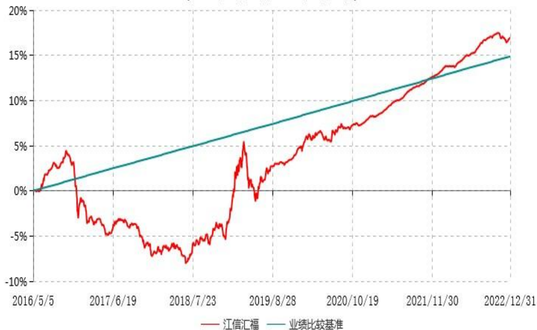
江信汇福定期开放债券型证券投资基金累计净值增长率与业绩比较基准收益率历史走势对比图 (2016年05月05日-2022年12月31日)