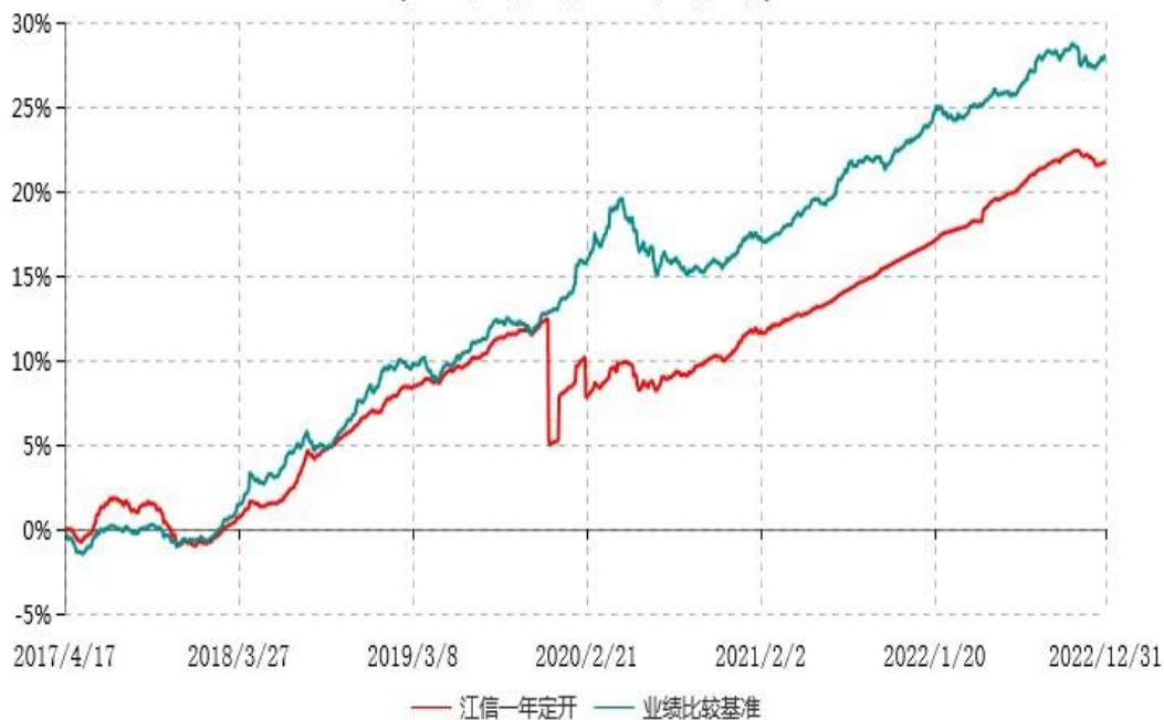
江信一年定期开放债券型证券投资基金累计净值增长率与业绩比较基准收益率历史走势对比图 (2017年04月17日-2022年12月31日)