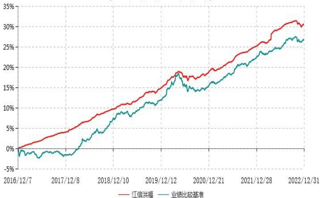
江信洪福纯债债券型证券投资基金累计净值增长率与业绩比较基准收益率历史走势对比图 (2016年12月07日-2022年12月31日)