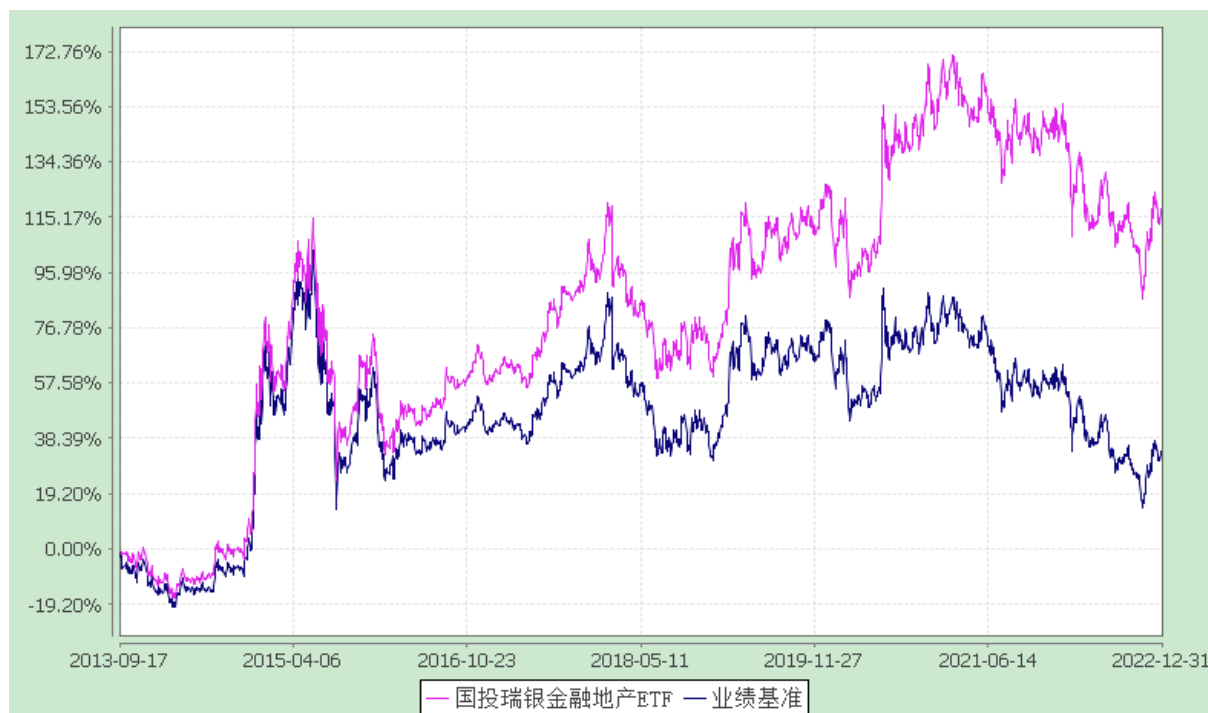
份额累计净值增长率与业绩比较基准收益率的历史走势对比图 (2013 年 9 月 17 日至 2022 年 12 月 31 日)

注：本基金建仓期为自基金合同生效日起的 3 个月。截至建仓期结束，本基金各项资产配置比例符合基金合同及招募说明书有关投资比例的约定。