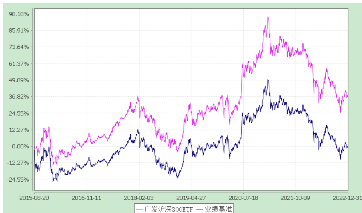
广发沪深 300 交易型开放式指数证券投资基金 份额累计净值增长率与业绩比较基准收益率的历史走势对比图 (2015 年 8 月 20 日至 2022 年 12 月 31 日)