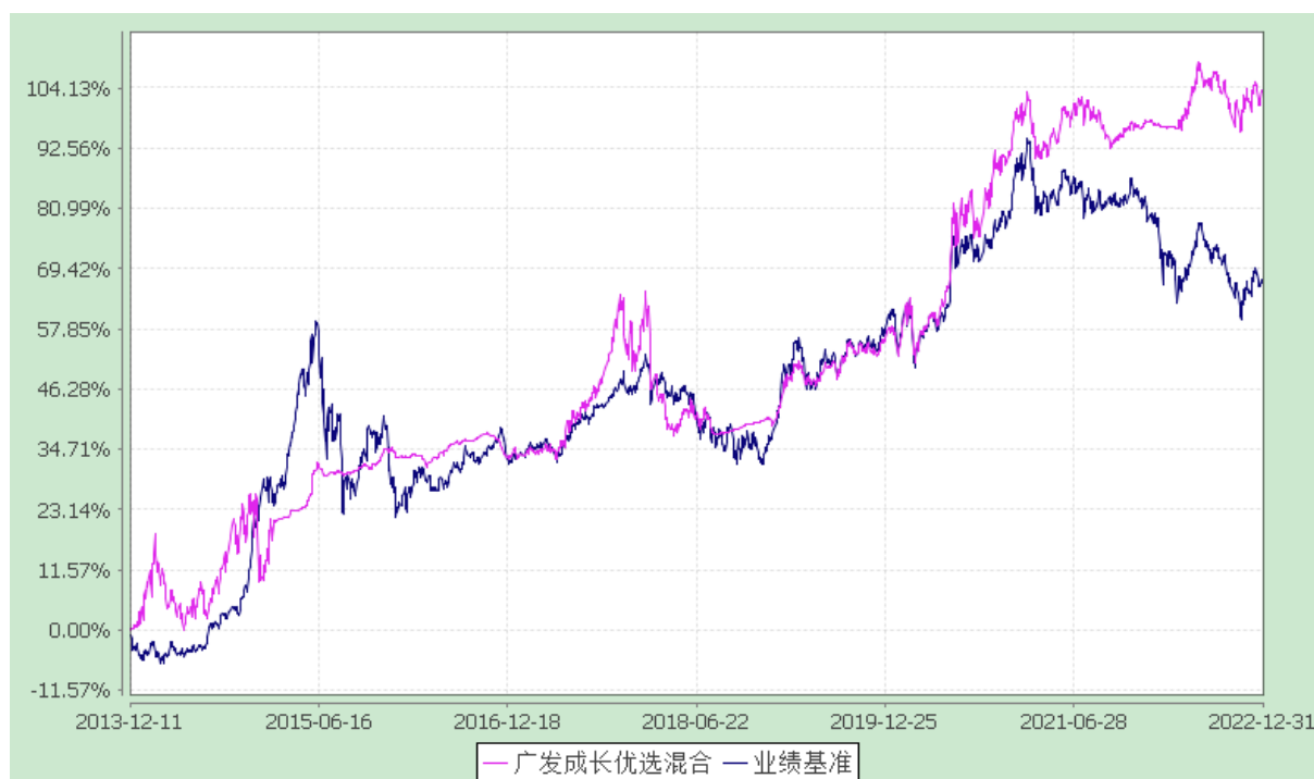
广发成长优选灵活配置混合型证券投资基金 份额累计净值增长率与业绩比较基准收益率的历史走势对比图 (2013 年 12 月 11 日至 2022 年 12 月 31 日)