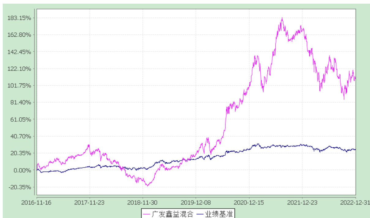
广发鑫益灵活配置混合型证券投资基金 份额累计净值增长率与业绩比较基准收益率的历史走势对比图 (2016 年 11 月 16 日至 2022 年 12 月 31 日)