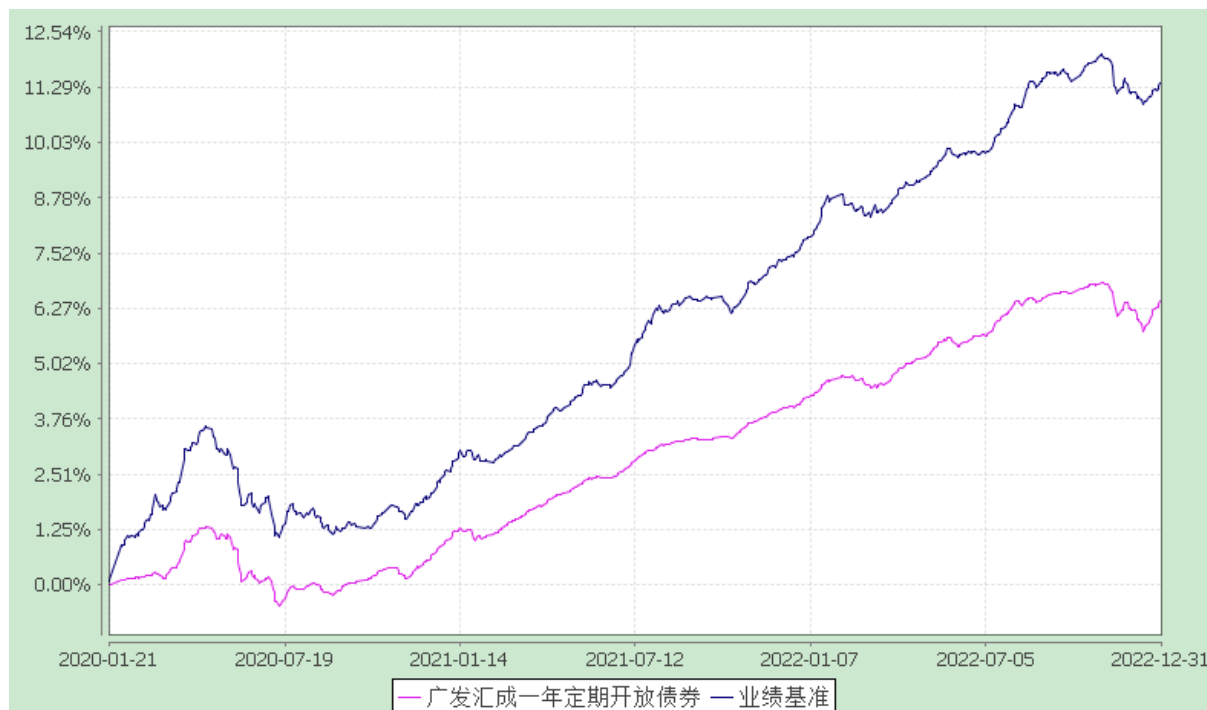
广发汇成一年定期开放债券型发起式证券投资基金 份额累计净值增长率与业绩比较基准收益率的历史走势对比图 (2020 年 1 月 21 日至 2022 年 12 月 31 日)