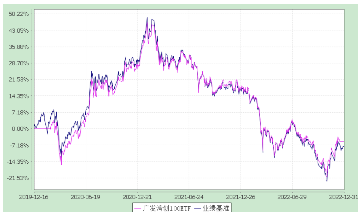
广发粤港澳大湾区创新 100 交易型开放式指数证券投资基金 份额累计净值增长率与业绩比较基准收益率的历史走势对比图 (2019 年 12 月 16 日至 2022 年 12 月 31 日)