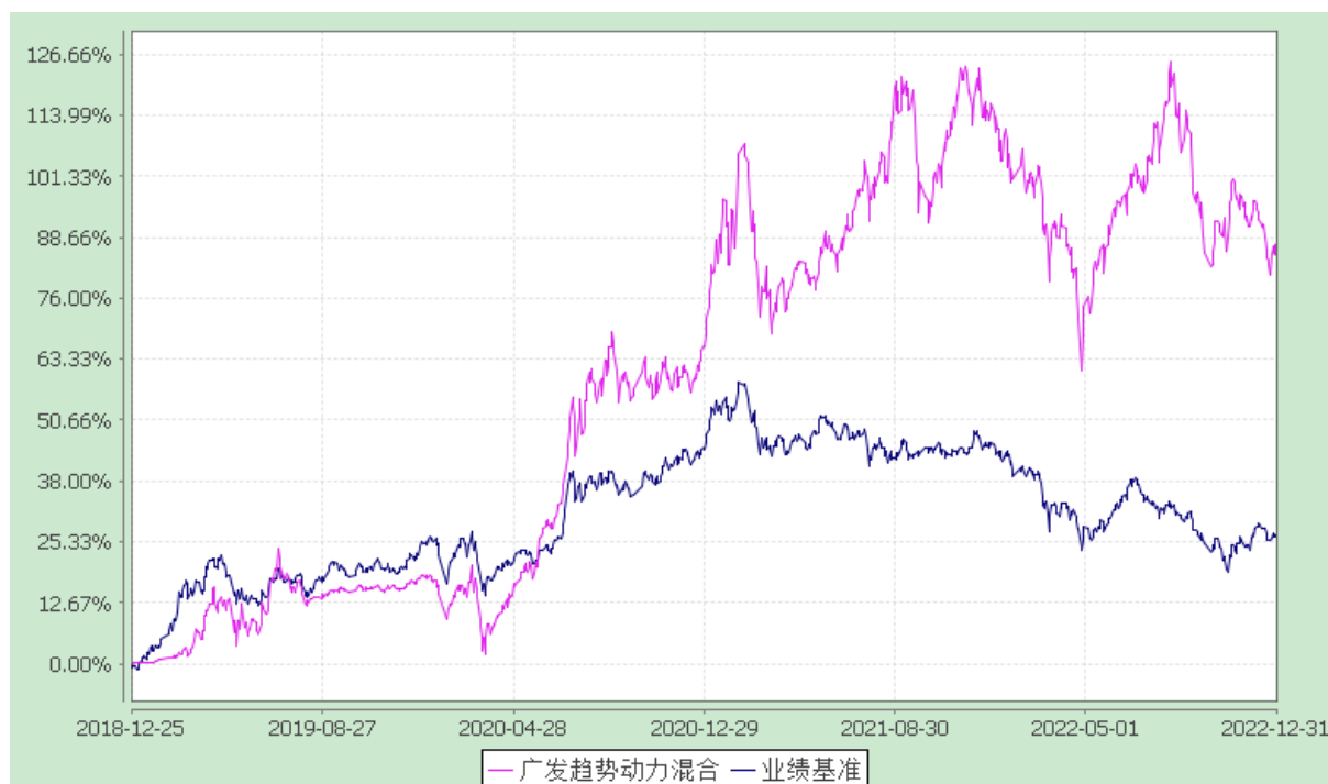
广发趋势动力灵活配置混合型证券投资基金 份额累计净值增长率与业绩比较基准收益率的历史走势对比图 (2018 年 12 月 25 日至 2022 年 12 月 31 日)