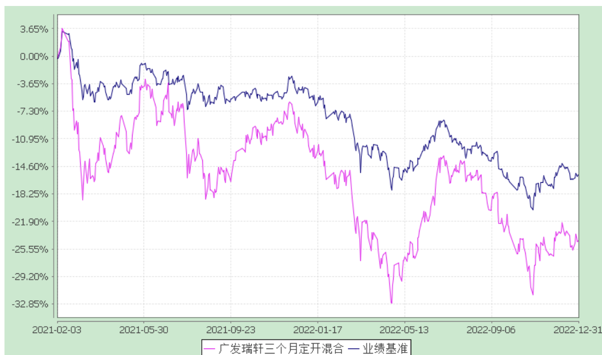
广发瑞轩三个月定期开放混合型发起式证券投资基金 份额累计净值增长率与业绩比较基准收益率的历史走势对比图 (2021 年 2 月 3 日至 2022 年 12 月 31 日)