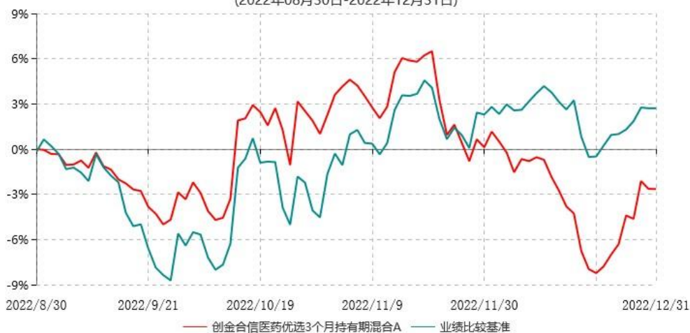
创金合信医药优选3个月持有期混合A累计净值增长率与业绩比较基准收益率历史走势对比图 (2022年08月30日-2022年12月31日)