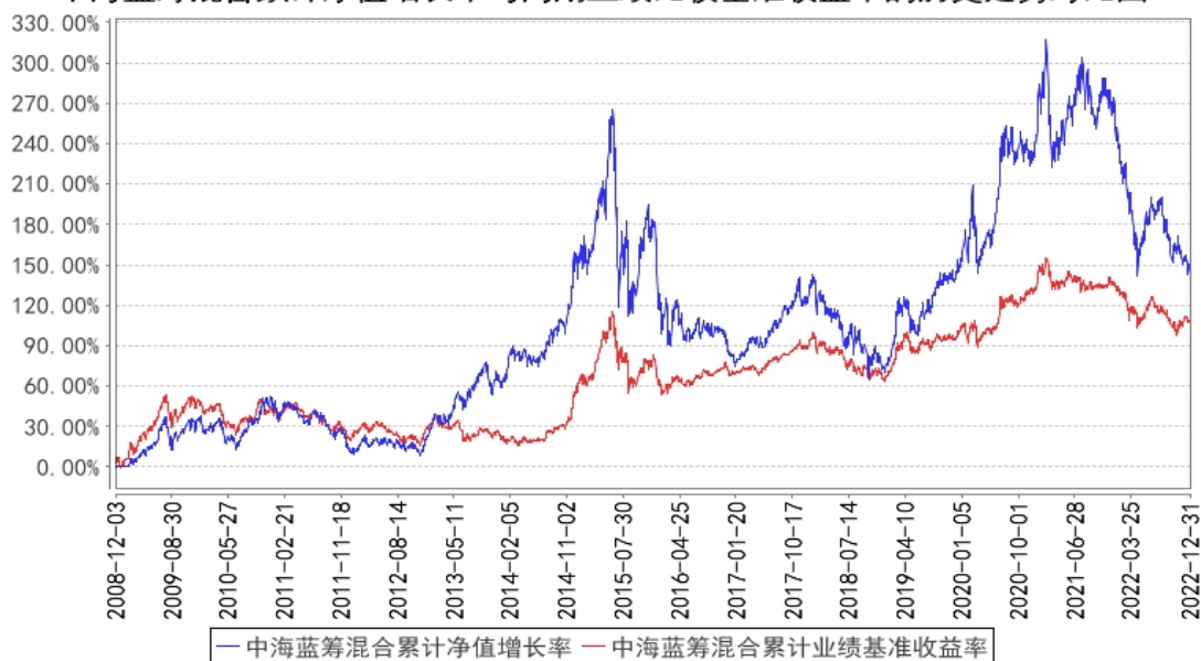
中海蓝筹混合累计净值增长率与同期业绩比较基准收益率的历史走势对比图