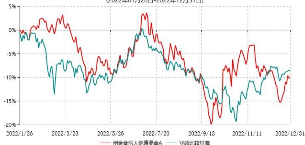
创金合信大健康混合A累计净值增长率与业绩比较基准收益率历史走势对比图 (2022年01月26日-2022年12月31日)