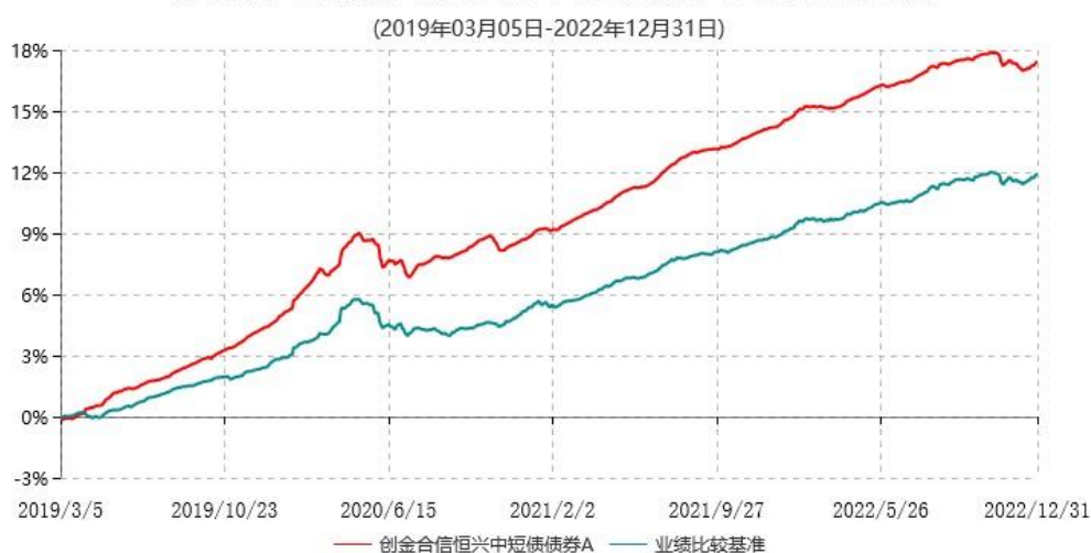
创金合信恒兴中短债债券A累计净值增长率与业绩比较基准收益率历史走势对比图