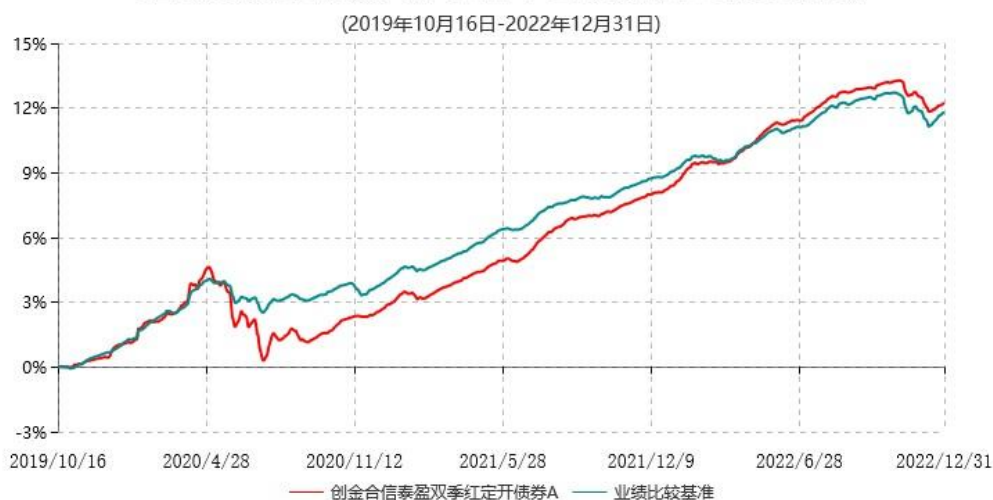
创金合信泰盈双季红定开债券A累计净值增长率与业绩比较基准收益率历史走势对比图