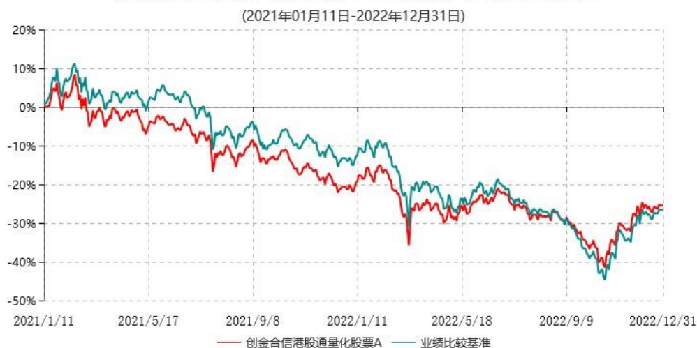
创金合信港股通量化股票A累计净值增长率与业绩比较基准收益率历史走势对比图