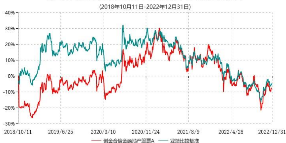
创金合信金融地产股票A累计净值增长率与业绩比较基准收益率历史走势对比图