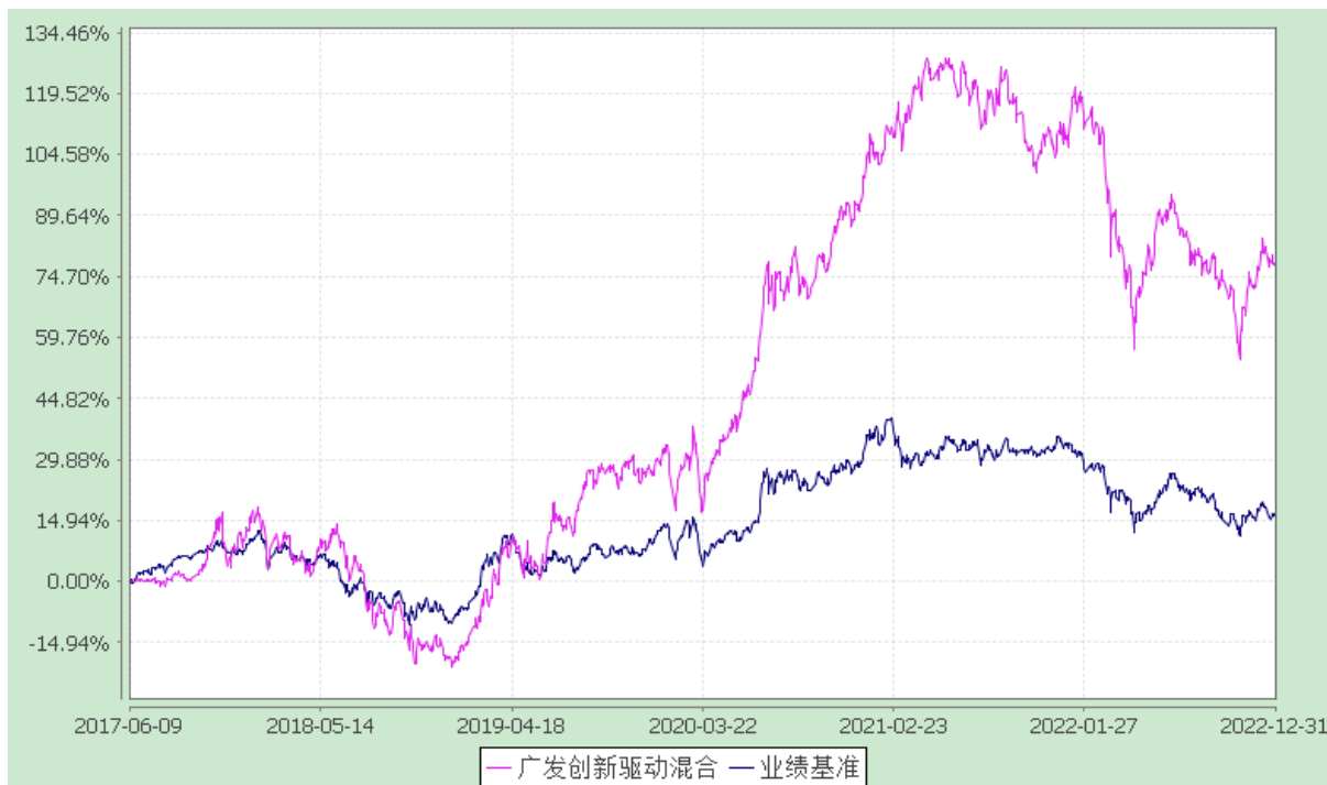
广发创新驱动灵活配置混合型证券投资基金 份额累计净值增长率与业绩比较基准收益率的历史走势对比图 (2017 年 6 月 9 日至 2022 年 12 月 31 日)