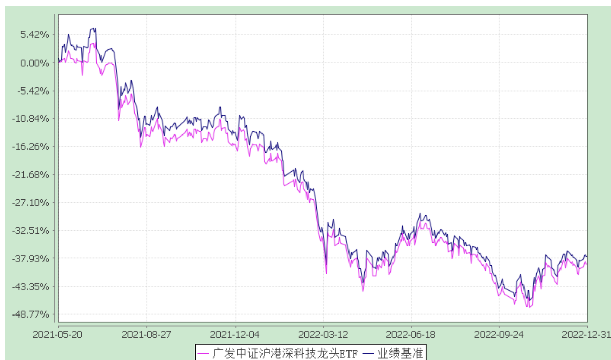
广发中证沪港深科技龙头交易型开放式指数证券投资基金 份额累计净值增长率与业绩比较基准收益率的历史走势对比图 (2021年5月20日至2022年12月31日)