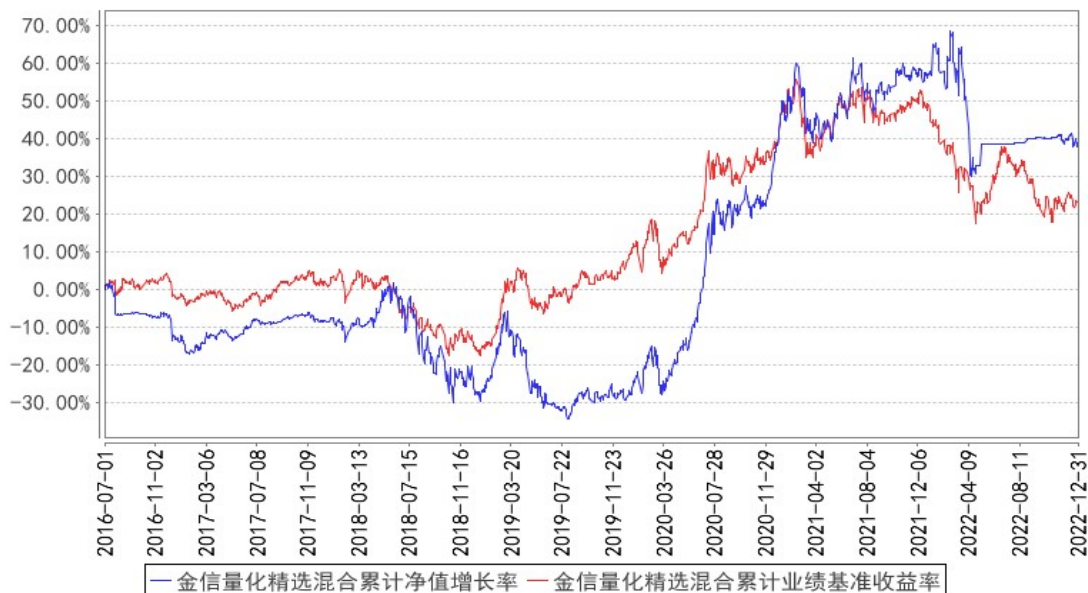
金信量化精选混合累计净值增长率与同期业绩比较基准收益率的历史走势对比图