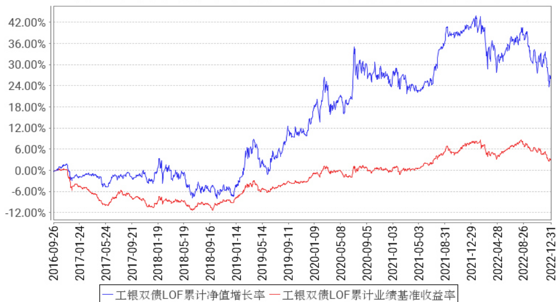
工银双债LOF累计净值增长率与同期业绩比较基准收益率的历史走势对比图

注：1、本基金于 2016 年 9 月 26 日由“工银瑞信双债增强债券型证券投资基金”转型而来。