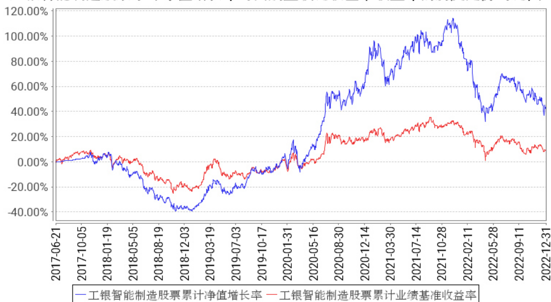
工银智能制造股票累计净值增长率与同期业绩比较基准收益率的历史走势对比图