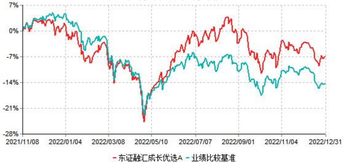
东证融汇成长优选A累计净值增长率与业绩比较基准收益率历史走势对比图 (2021年11月08日-2022年12月31日)