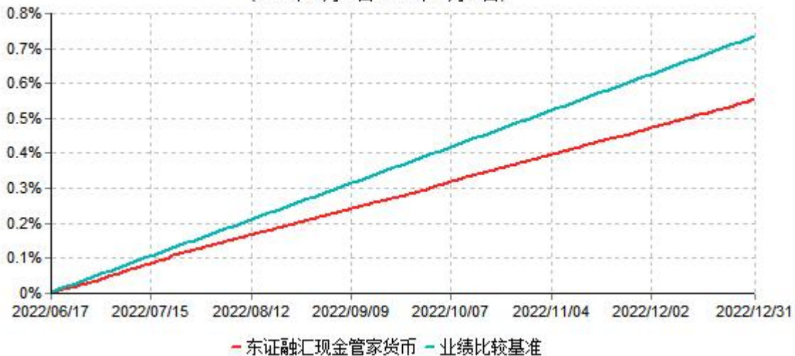
东证融汇现金管家货币型集合资产管理计划累计净值收益率与业绩比较基准收益率历史走势对比图 (2022年06月17日-2022年12月31日)