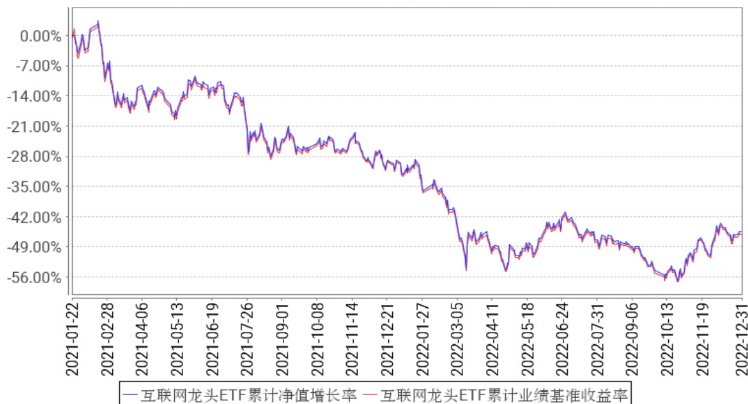
互联网龙头ETF累计净值增长率与同期业绩比较基准收益率的历史走势对比图