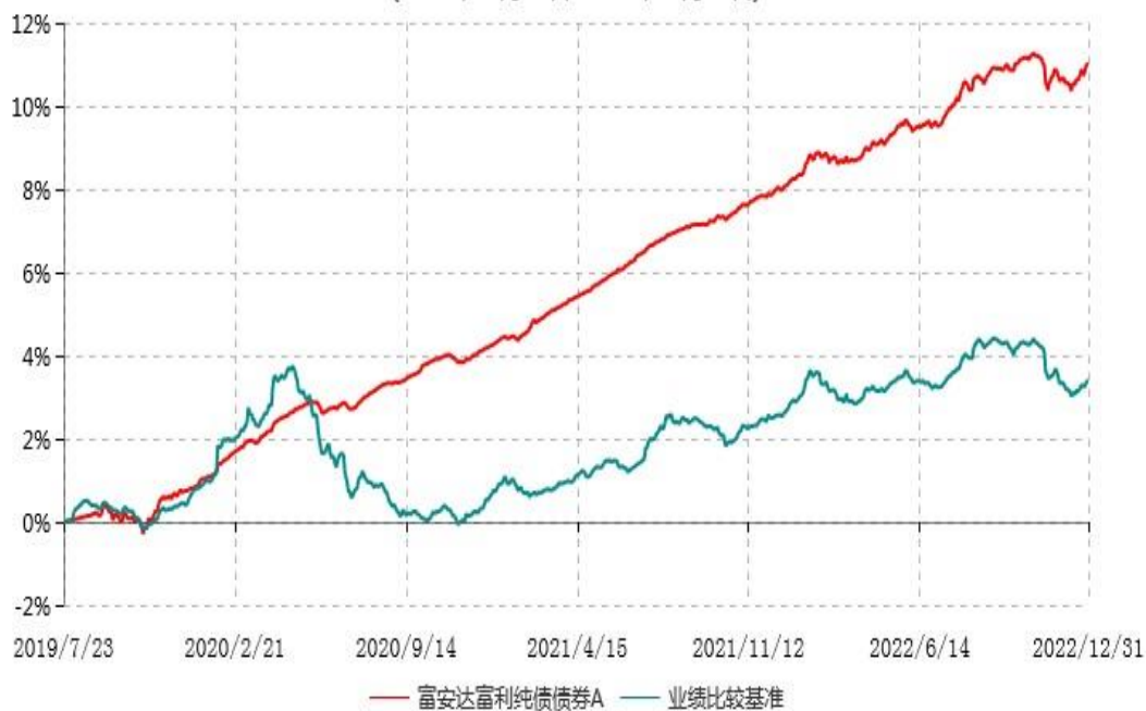
富安达富利纯债债券A累计净值增长率与业绩比较基准收益率历史走势对比图 (2019年07月23日-2022年12月31日)