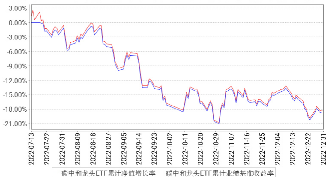
碳中和龙头ETF累计净值增长率与同期业绩比较基准收益率的历史走势对比图

注：1、本基金基金合同于 2022 年 07 月 13 日生效。截至报告期末，本基金尚处于建仓期。