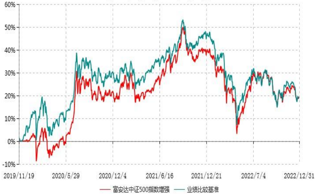
富安达中证500指数增强型证券投资基金累计净值增长率与业绩比较基准收益率历史走势对比图 (2019年11月19日-2022年12月31日)