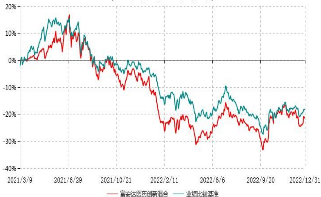
富安达医药创新混合型证券投资基金累计净值增长率与业绩比较基准收益率历史走势对比图 (2021年03月09日-2022年12月31日)