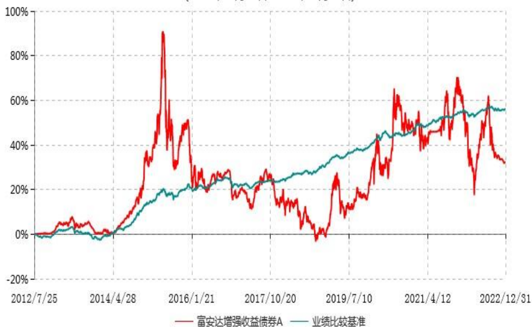
富安达增强收益债券A累计净值增长率与业绩比较基准收益率历史走势对比图 (2012年07月25日-2022年12月31日)