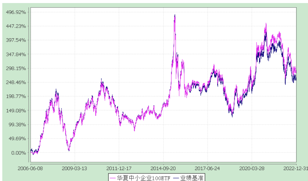
中小企业 100 交易型开放式指数基金 份额累计净值增长率与业绩比较基准收益率历史走势对比图 (2006 年 6 月 8 日至 2022 年 12 月 31 日)