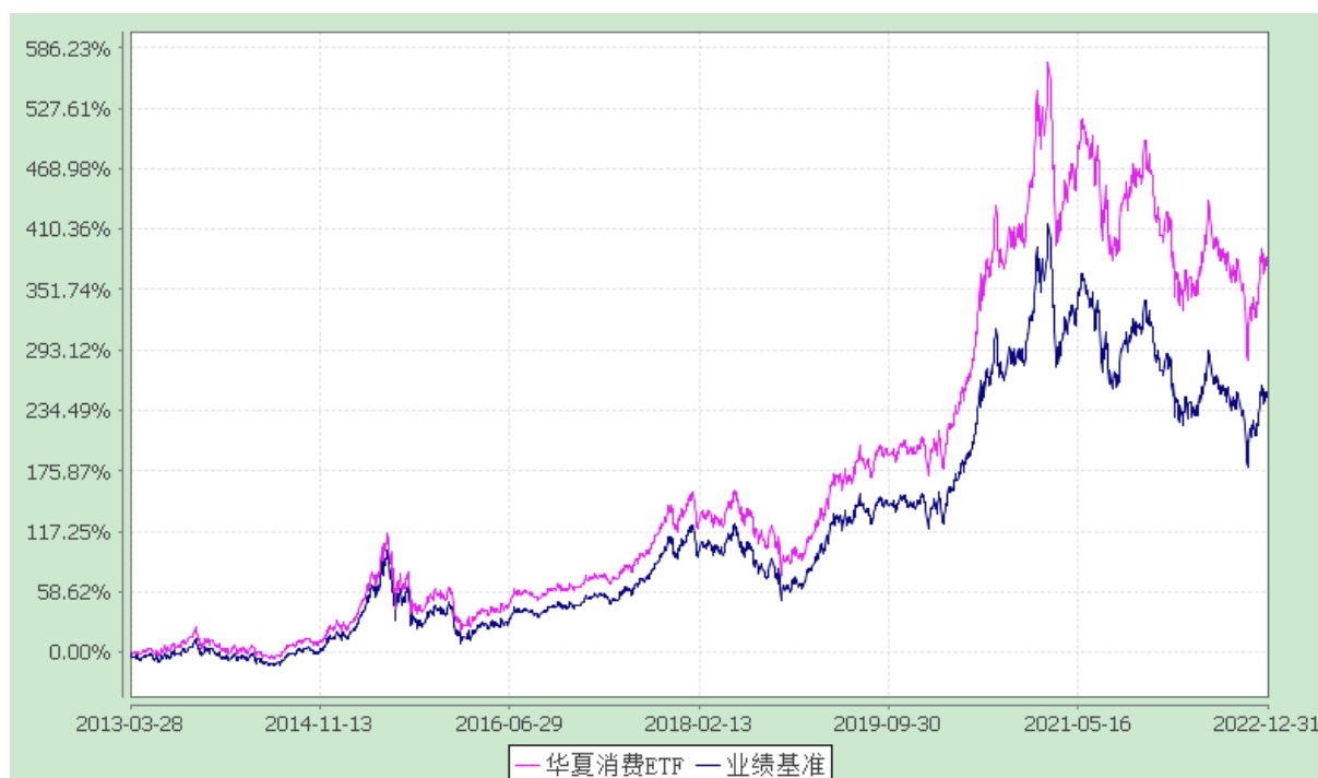
上证主要消费交易型开放式指数发起式证券投资基金 份额累计净值增长率与业绩比较基准收益率历史走势对比图 (2013年3月28日至2022年12月31日)