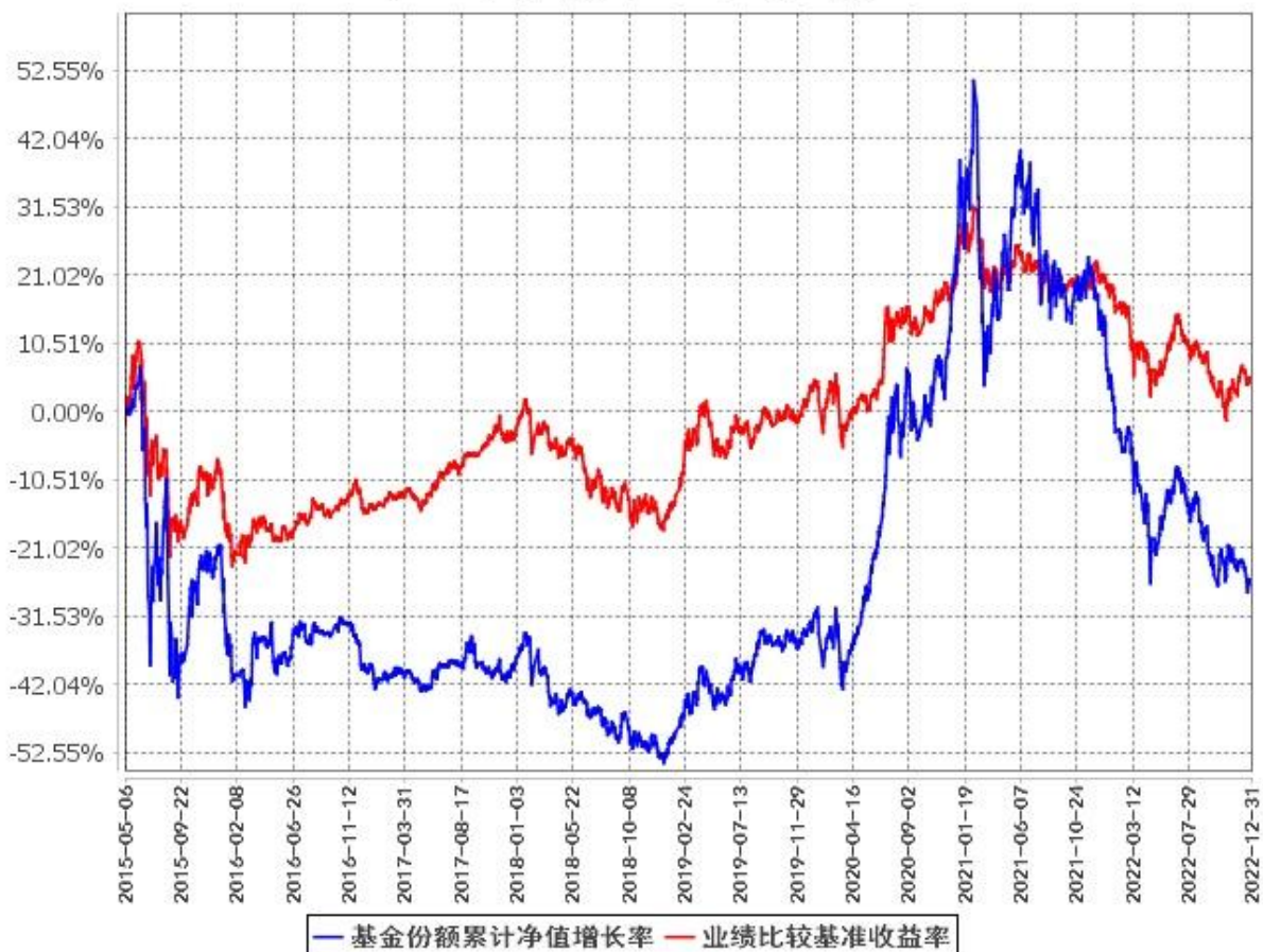
基金份额累计净值增长率与同期业绩比较基准收益率的历史走势对比图 (2015年5月6日至2022年12月31日)