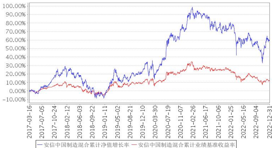
安信中国制造混合累计净值增长率与同期业绩比较基准收益率的历史走势对比图