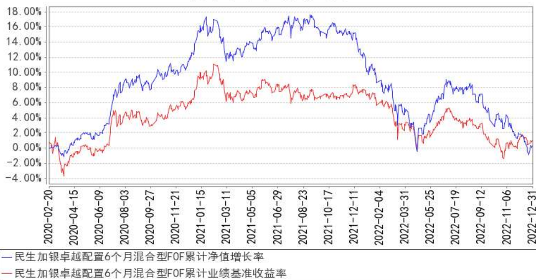
民生加银卓越配置6个月混合型FOF累计净值增长率与同期业绩比较基准收益率的历史走势对比图

注：本基金合同于2020年02月20日生效。本基金建仓期为自基金合同生效日起的6个月。截至建仓期结束，本基金各项资产配置比例符合基金合同及招募说明书有关投资比例的约定。