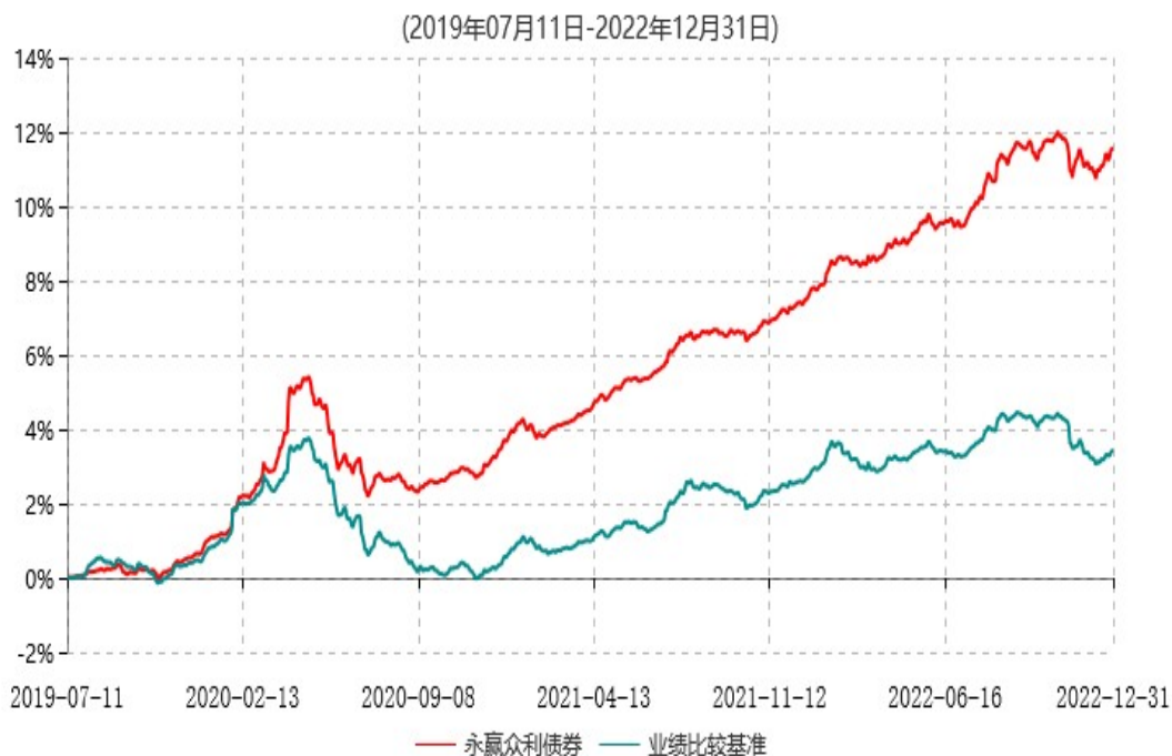
永赢众利债券型证券投资基金累计净值增长率与业绩比较基准收益率历史走势对比图